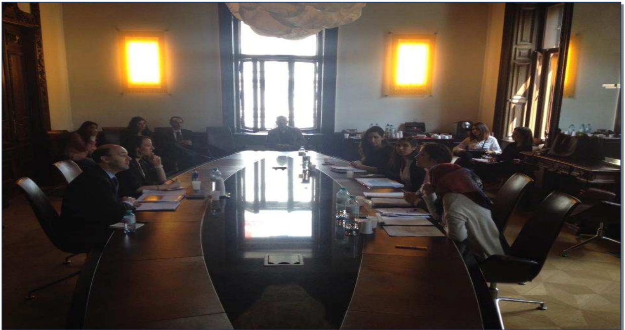
During the Pitt Consortium at Baker and McKenzie Law Firm University of Jordan vs. BirZeit University