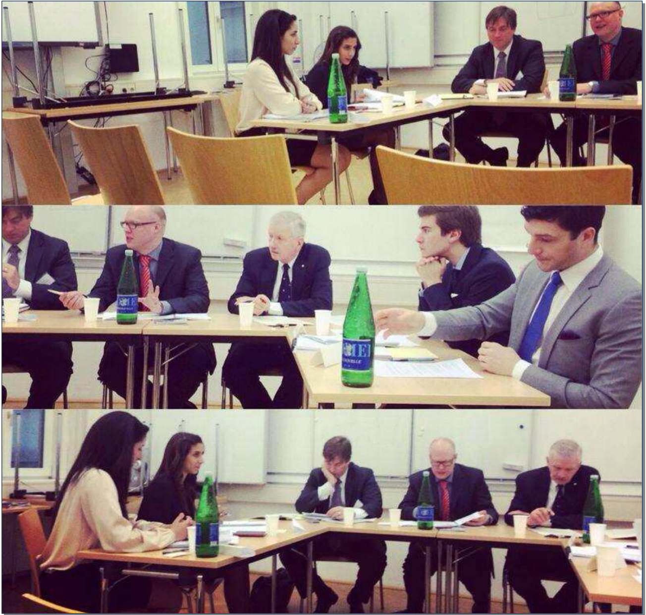
University of Jordan vs. Center for Transnational Legal Studies - London